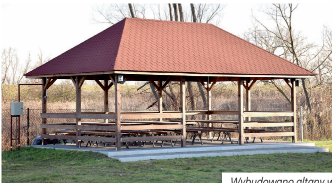
Wybudowano altany w Koćmierzowie i Jachimowicach.

pochylnię dla niepełnosprawnych. Koszty poniesione na realizację całego zakresu prac wynoszą 141 525 zł.