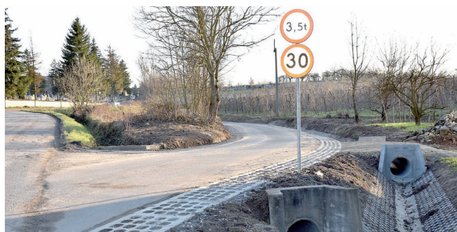
Przebudowano drogę za cmentarzem w Chobrzanych.