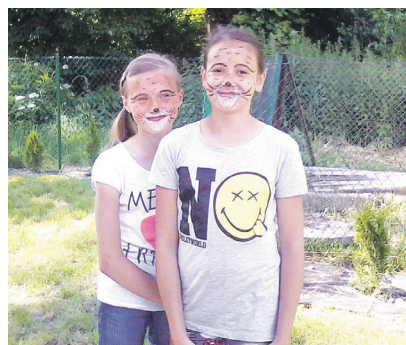
Jedną z inicjatyw stowarzyszenia była organizacja Dnia Dziecka.

Stowarzyszenie „Dobro Wspólne Jachimowic” powstało w marcu 2016 roku. Mimo tego, że działa ono niecały rok, może pochwalić się imponującymi osiągnięciami.