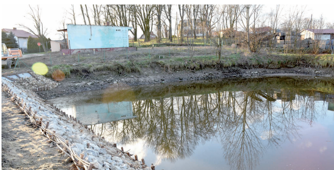
Trwa zabezpieczanie zbiornika wodnego w Janowicach.