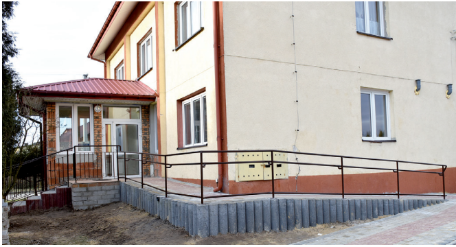
Dobudowano wiatrotłap do budynku ośrodka zdrowia w Chobrzanach.