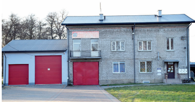
Nadbudowano dach na budynku świetlicy wiejskiej w Skotnikach.

Gmina wspólnie z Samodzielnym Publicznym Zakładem Opieki Zdrowotnej w Samborcu zrealizowała zadanie pod nazwą „Rozbudowa istniejącego budynku mieszkalno-usługowego o wiatrołap i przebudowa pomieszczeń” w miejscowości Chobrzany. Dodatkowo zamontowano