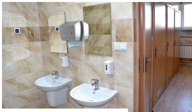
Zmodernizowano łazienki w SP w Skotnikach.