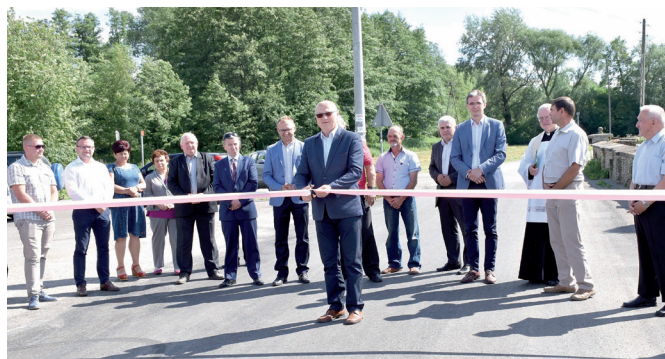
Otwarcie drogi w Skotnikach.