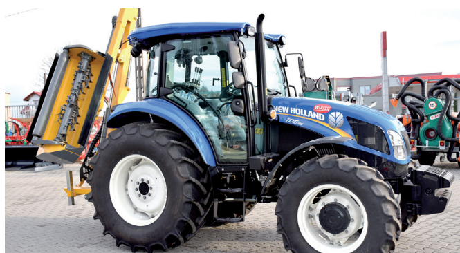
Za ponad 200 tys. zł zakupiono ciągnik wraz z osprzętem.