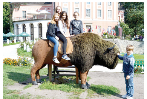
W składzie zwycięskiej ekipy znalazły się cztery dziewczyny.

Uczestnicy wycieczki obejrzeli także wnętrze pałacu, salę balową, salony, taras widokowy, krużganki, kaplicę z XVIII wieku i dziedziniec. Ciekawą podróż zakończył wspólny obiad w uroczej scenerii tuż przy kurozwęckim pałacu.