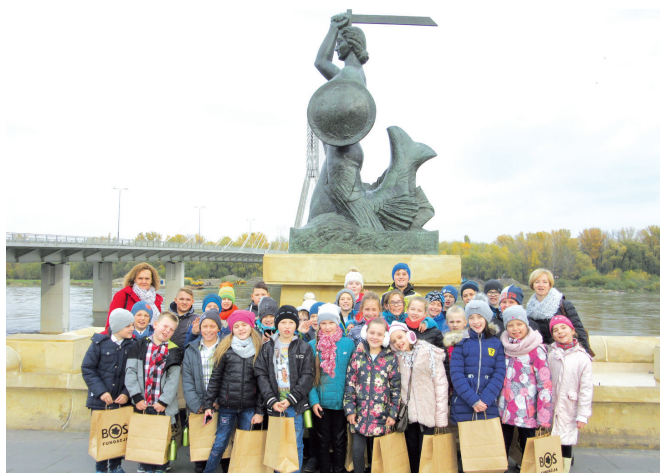
Uczniowie z Samborca pojechali do Warszawy na uroczystą galę podsumowującą projekt.

Należy podkreślić, że do konkursu zgłosiło się ponad 500 szkół z całej Polski, a uczniowie z Samborca go wygrali. Zdobyli grand prix w klasyfikacji rocznej.