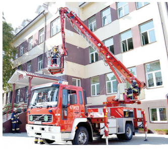
Z uwagi na tempo, z jakim rozprzestrzenił się ogień, jedną z osób trzeba było ewakuować przy pomocy podnosnika koszowego.

20 września w sali konferencyjnej budynku Urzędu Gminy Samborzec odbyło się spotkanie promujące płytę „Jestem sobie Gorzyczanka”.