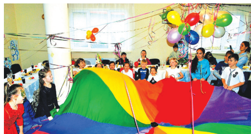
Na zakończenie zimowego wypoczynku odbył się kinderbal.

Zimowa przerwa w nauce upłynęła pod znakiem wyśmienitej zabawy, z której korzystali zarówno starsi, jak i młodszy mieszkańcy gminy.