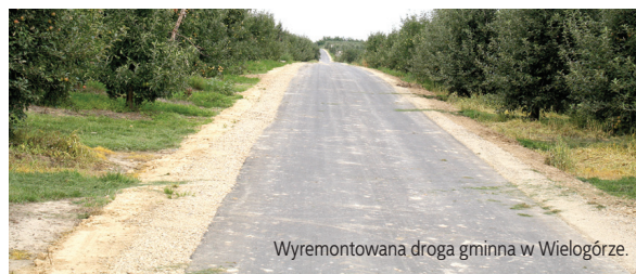
Wyremontowana droga gminna w Wielogórze.